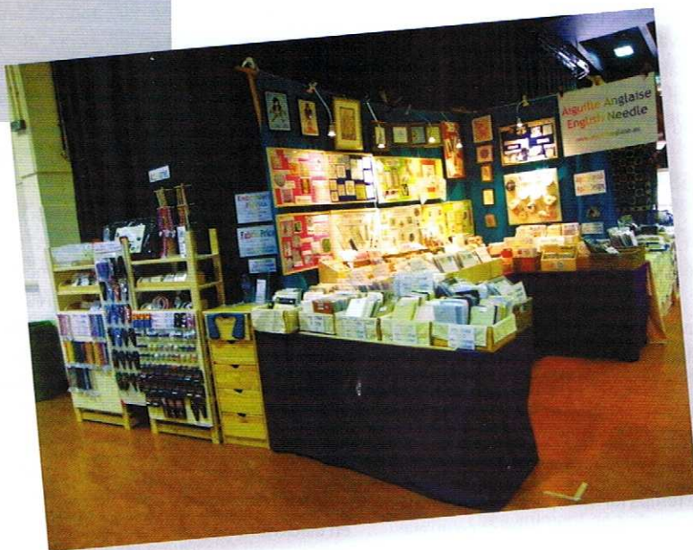
le stand à Sandown Park (Royaume-Uni)