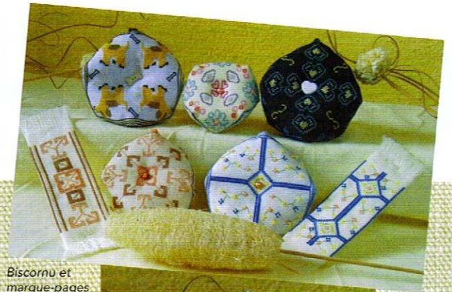
Bicornu et marque-pages