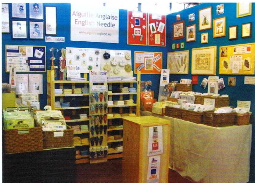
Le stand à Montpellier

croix et d'autres techniques de broderie. Elle propose souvent de réaliser le même modèle au point de croix, en broderie d'Assise et en blackwork.